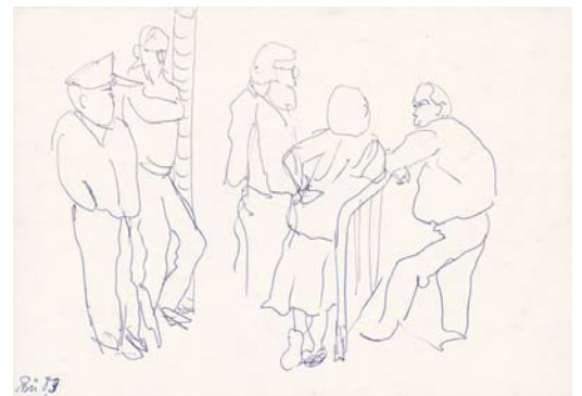
1983 Zuschauer beim Boulespiel